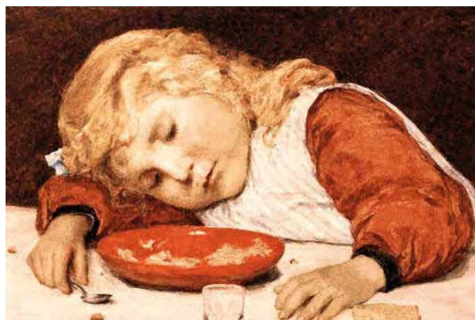
Anker, Albert 1831-1910. „Schlafendes Mädchen“, 1909. Aquarell

einzuschlafen, loszulassen, den Mundbereich vertrauensvoll abzugeben und die Zahnärzte ihre Arbeit tun zu lassen. Utopie? Nun denn, wir leben sie!