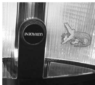
Bild an der Behandlungsleuchte

wie weit der Mund aufgemacht werden muss. Durch den Behandler wird suggeriert, dass das Kind selbst ein Krokodil ist und den Mund ganz weit aufmacht, damit der Zahnputzervogel gut darin arbeiten kann und alles schön sauber wird. An der Behandlungsleuchte kann auch ein Bild vom Krokodil mit Zahnputzvogel angebracht werden - das erinnert die Kinder immer an die weite Mundöffnung.