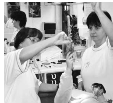
Luftballonreise mit Zauberstab