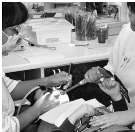
Hilfsmittel während der QuickTimeTrance

die individuellen Bedürfnisse der kleinen Patienten erforderlich, aber mit etwas Übung und einem großen Fundus an Hilfsmitteln wird das bald zur Selbstverständlichkeit. So kann die Zahnbehandlung von Kindern zu einer interessanten, spannenden