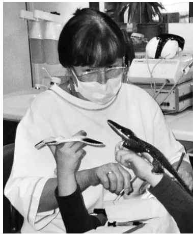
Zauberermöwe und Krokodil

und fest werden. Dabei dürfen die Kinder die Lampe selbst halten und werden somit wieder in die Behandlung integriert.