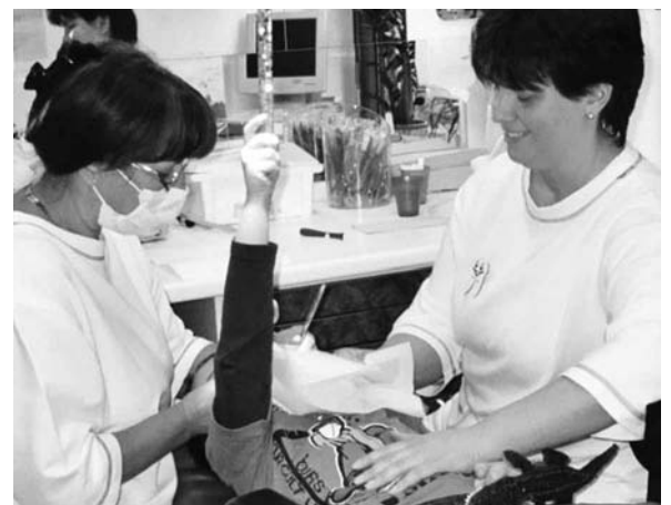
Ständiger Körperkontakt während der Zahnbehandlung