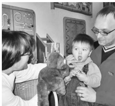
Rapportaufbau mit Bimbo

Dabei wird suggeriert, dass im Bauch ein großer Luftballon entsteht, der bei jedem Einatmen größer und größer wird und mit dem der kleine Patient hoch in die Luft