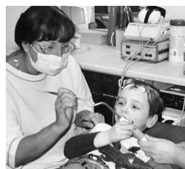
Das Kind hilft, die Zahnteufel zu vernichten

Diese Unterbrechung ist für den kleinen Patienten eine willkommene Abwechslung und er ist ganz stolz, wenn er die ‚ollen Zahnteufel‘ selbst wegzagen kann. Er wird ständig gelobt, wie toll er das macht und geht danach schnell und bereitwillig wieder mit seinem Luftballon in die nächste Kurztrance. Dieser ständige Wechsel von Trance und Unterbrechung bewirkt im Sinne einer fraktionierten Hypnose nach und nach eine Vertiefung und Verlängerung