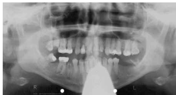
Abb. 3 Mitgeführtes Orthopantomogramm der Patientin

Nach Ausleitung der Hypnose und Reorientierung äußerte sich die Patientin sehr positiv über den ange-